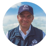
Carlos Camargo Assis DEFENSOR DEL PUEBLO COLOMBIA

Por último, y en correspondencia con lo expuesto, la Defensoría del Pueblo presenta conclusiones y recomendaciones derivadas del examen y análisis de la información. El propósito es reiterar la necesidad de cumplir de manera prioritaria y rigurosa con las obligaciones constitucionales, legales y jurisprudenciales que componen el “mínimo prestacional”, asegurando la protección de los derechos de las comunidades Jiw y Nükak. Esto implica abordar las causas profundas del desplazamiento forzado y las condiciones de vulnerabilidad asociadas, en el marco de medidas de prevención, atención y protección para estos pueblos.