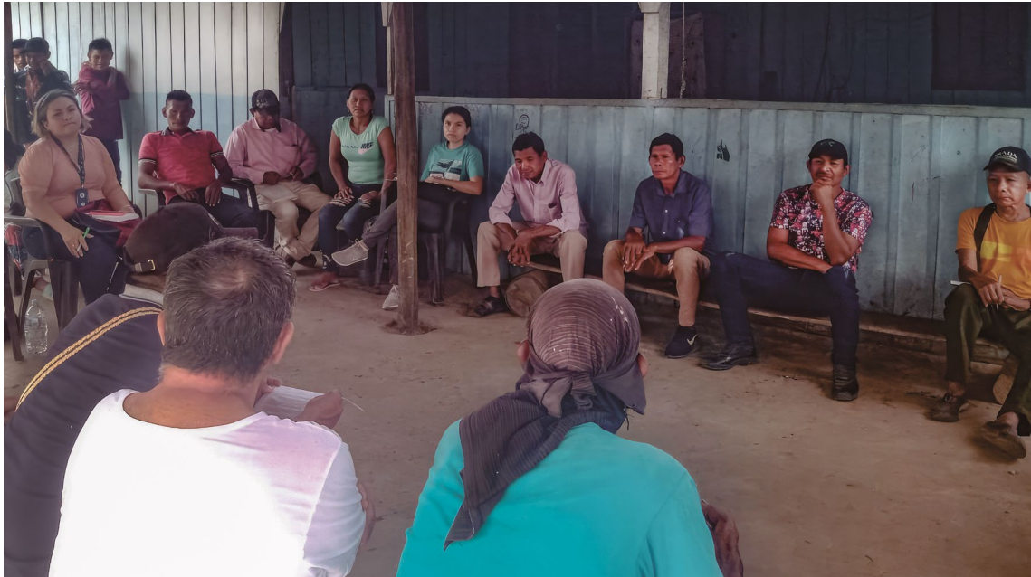
Fotografía 5. Resguardo Barrancón