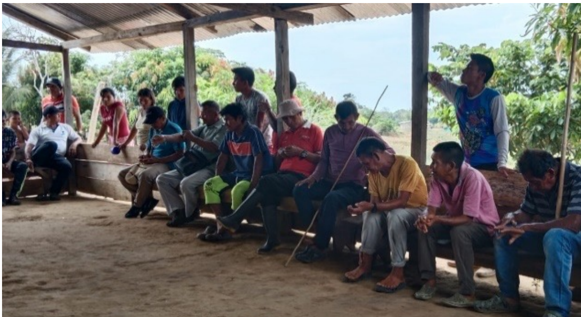
Fotografía 7. Resguardo Naxael Lajat en Mapiripán

Visita realizada el 15 de febrero de 2023.