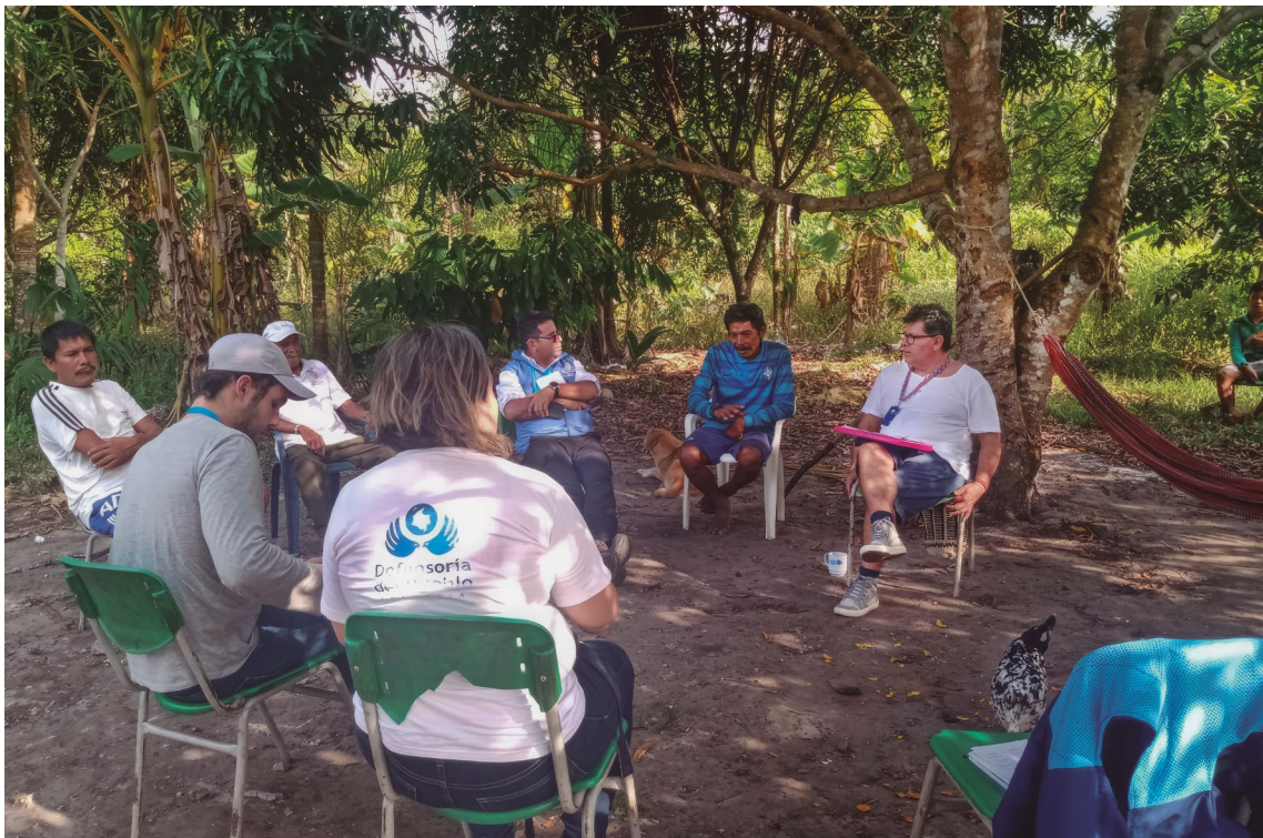
Visita realizada el 13 de febrero de 2023.