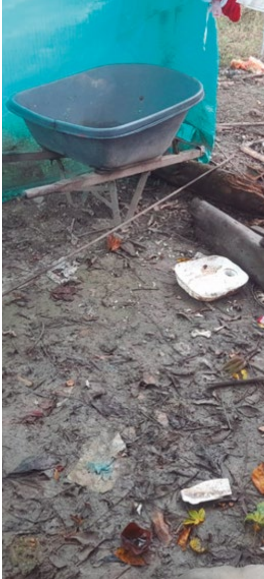
Fotografía 4. Resguardo La Fuga Fanas