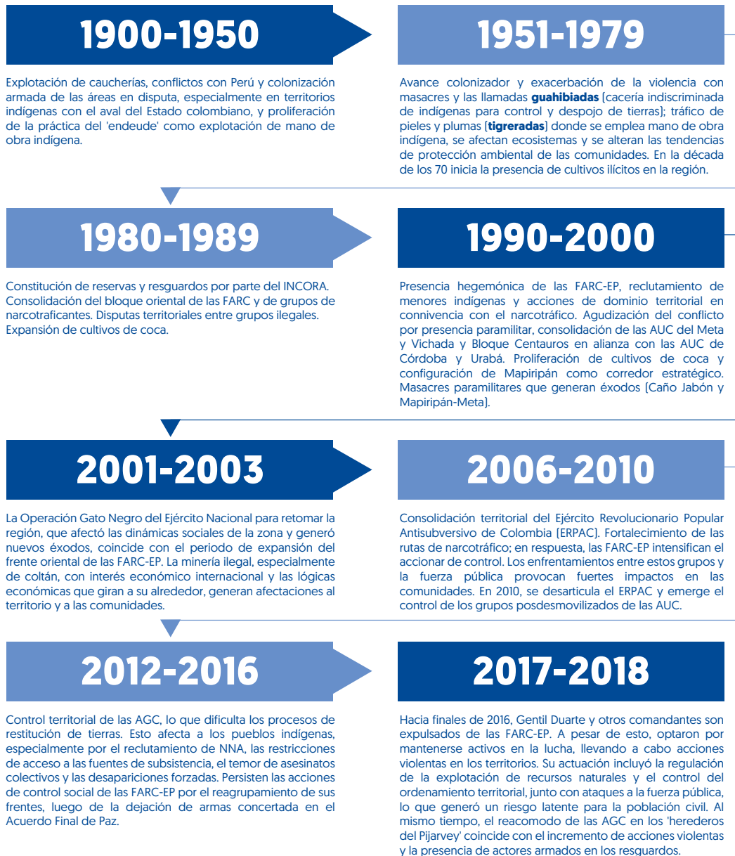
Figura 2. Contexto de las afectaciones al pueblo Jiw