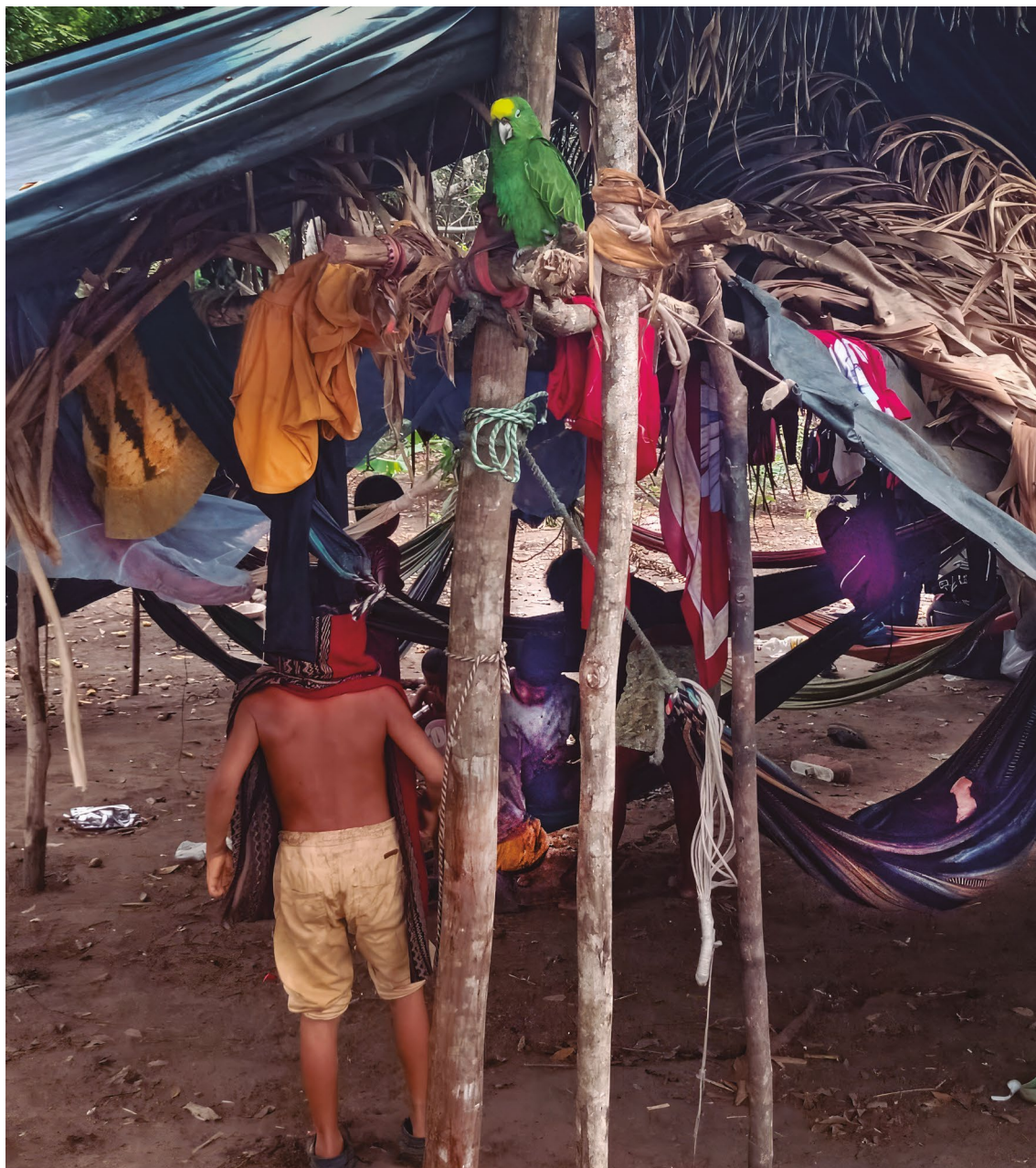
Fotografía 8. Asentamiento Agua Bonita

Visita realizada el 16 de febrero de 2023.