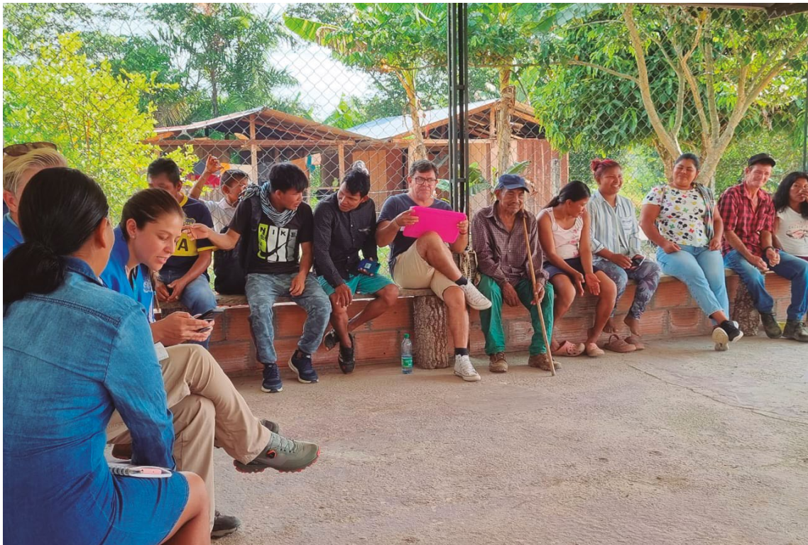
Fotografía 1. Resguardo La Fuga Fanas

Visita realizada el 14 de febrero de 2023.