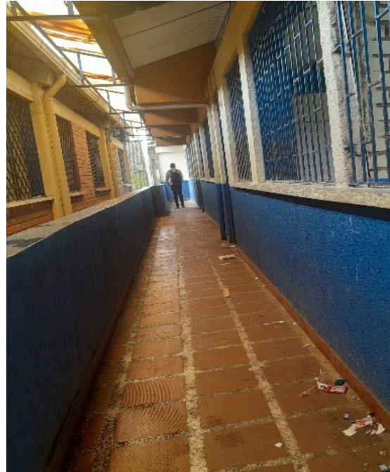
Defensoría del Pueblo. I.E. Tangareal, 21 de noviembre de 2023.

La Institución Educativa Tangareal está ubicada en el corregimiento Tangareal, del Distrito Especial de San Andrés de Tumaco. En esta sede son atendidos 1.200 estudiantes, en los niveles de preescolar, básica primaria, básica secundaria y media.