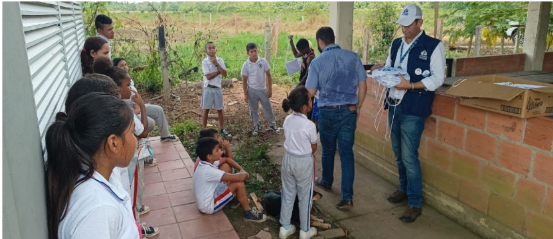
Defensoría del Pueblo. I.E. La Unión [Calamar], 25 de octubre de 2023.