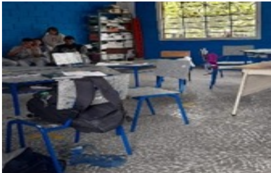
Defensoría del Pueblo. Visita a la sede educativa El Cedralito, Santa Rosa de Cabal, el 31 de agosto de 2023.