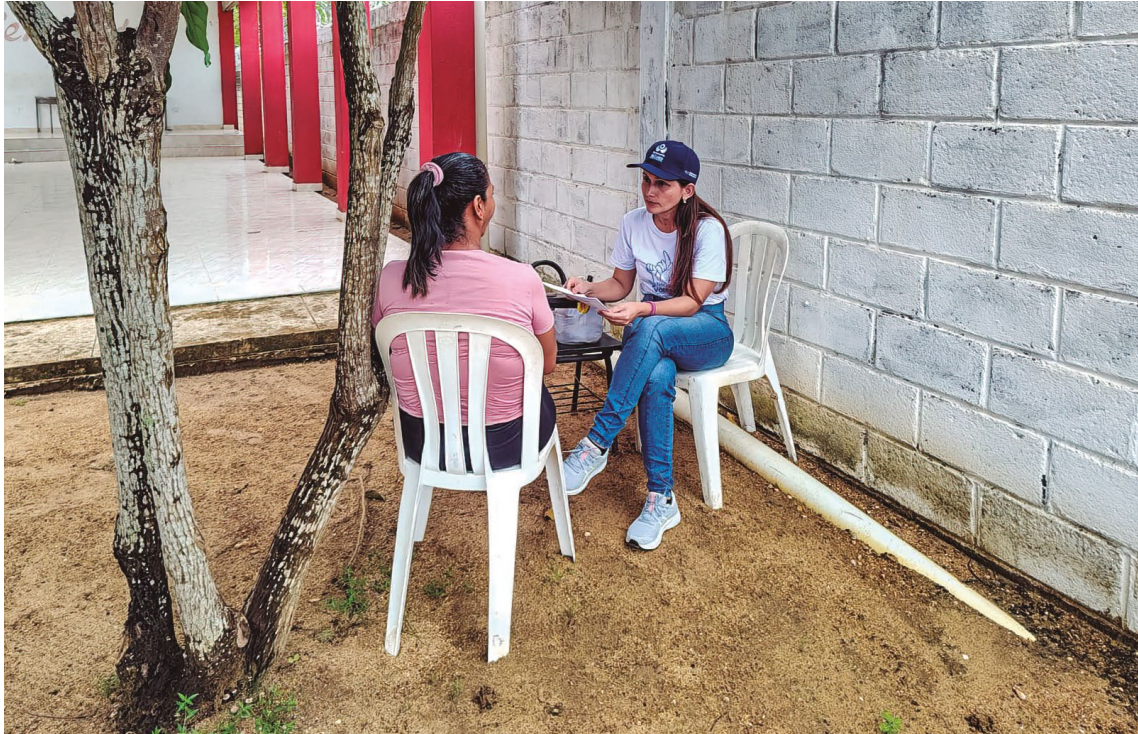
Defensoría del Pueblo. Centro Educativo San Roque. 14 de septiembre de 2023.

El Centro Educativo San Roque está ubicado en el corregimiento San Roque del municipio de San Benito Abad, Sucre 61 . En este centro educativo se atienden aproximadamente 116 niños, niñas y adolescentes en edades entre 5 y 13 años. En el nivel de preescolar están matriculados 18 estudiantes y en básica primaria, 98.