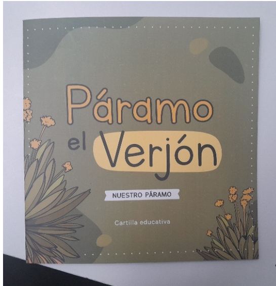
Defensoría del Pueblo. I.E. Rural El Verjón, 6 de octubre de 2023.

La Institución Educativa Rural El Verjón se ubicada en la localidad de Santa Fe de Bogotá, D.C. En esta sede son atendidos 240 estudiantes en edades entre 4 a 19 años, en los niveles de preescolar [14], básica primaria [100], básica secundaria y media [130].