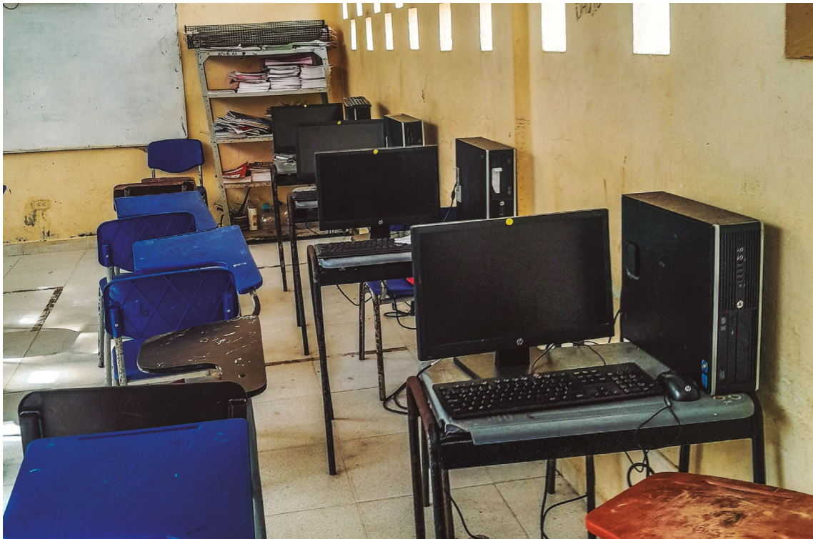
Defensoría del Pueblo. Instituto Educativo Samurindó, 27 de septiembre de 2023.

El Instituto Educativo de Samurindó está ubicado en el corregimiento del mismo nombre y cuenta con siete sedes educativas. En esta sede son atendidos 336 estudiantes, cuyas edades oscilan entre los 5 y 20 años. La distribución por niveles educativos es la siguiente: 20 estudiantes en preescolar, 103 en básica primaria y 298 en básica secundaria y media.