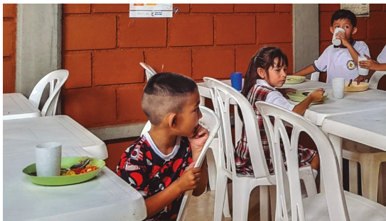
Defensoría del Pueblo. Visita a la sede educativa Las Mangas, Santa Rosa de Cabal, el 31 de agosto de 2023.