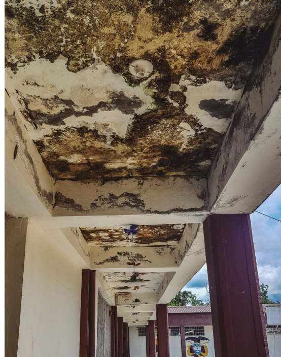
Defensoría del Pueblo. I.E. Antonio Abad Hincastroza Mena, 27 de septiembre de 2023.

La Institución Educativa Antonio Abad Hincastroza Mena, sede Doña Josefa, está ubicada en el corregimiento Doña Josefa y atiende a alrededor de 210 estudiantes en los niveles de preescolar y básica primaria.