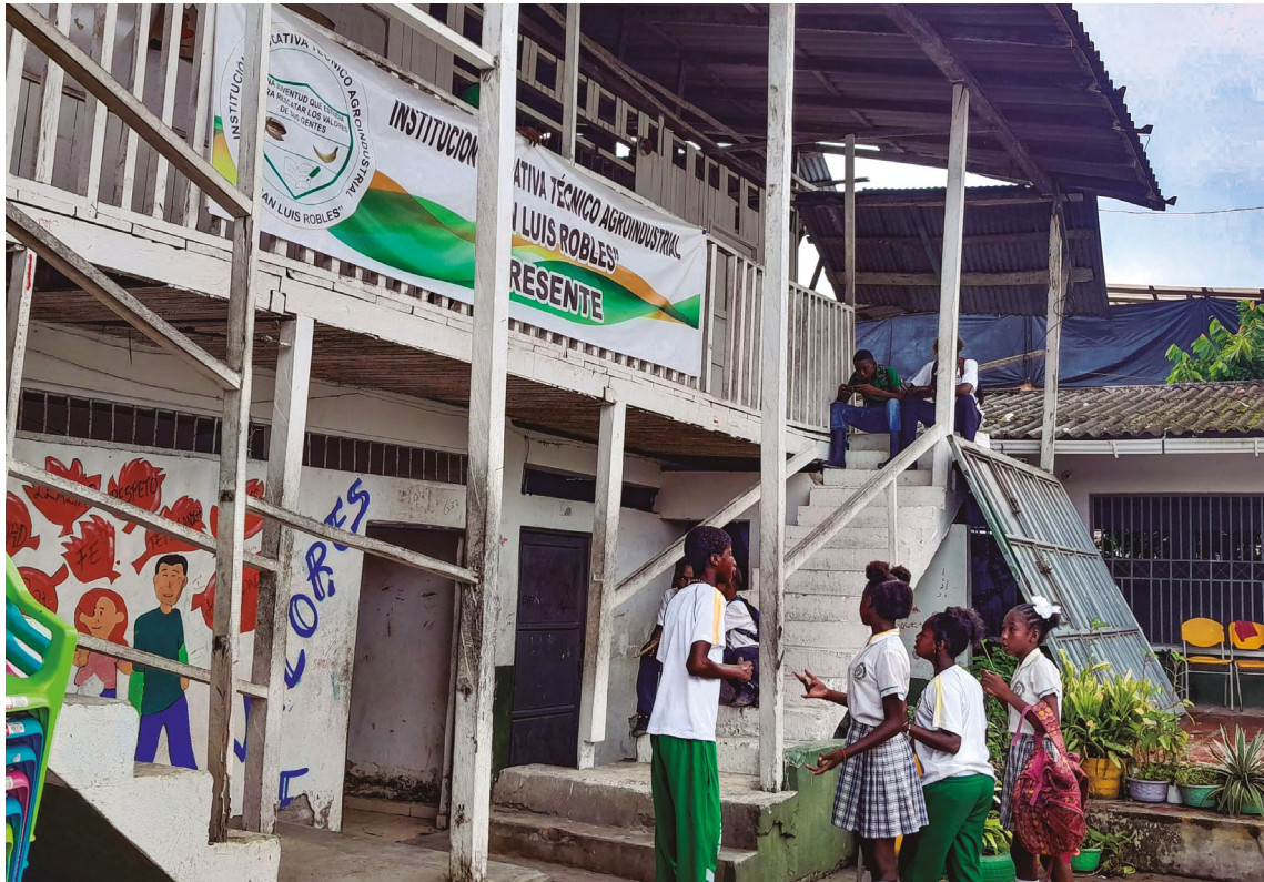
Defensoría del Pueblo. I.E. San Luis Robles, 22 de noviembre de 2023.

La Institución Educativa San Luis Robles está ubicada en el Corregimiento Robles del municipio de San Andrés de Tumaco. En esta sede son atendidos 630 niños, niñas y adolescentes, cuyas edades oscilan entre los 5 y 17 años, en los niveles de preescolar [44], básica primaria [280], básica secundaria [300] y media [85].