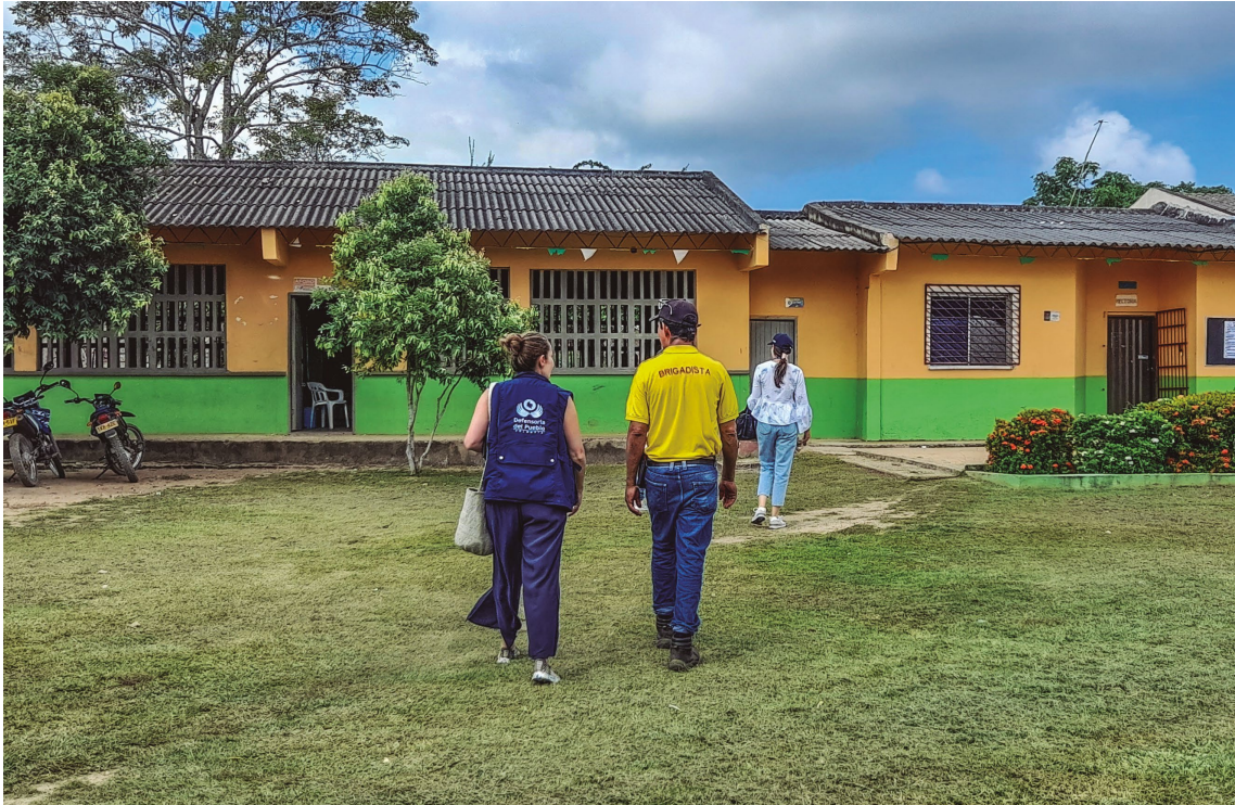
Defensoría del Pueblo. Institución Educativa Libertad, 14 de septiembre de 2023.

La I.E. La Libertad se encuentra ubicada en el corregimiento Libertad del municipio de San Onofre, Sucre. Allí son atendidos alrededor de 1.018 estudiantes entre los 4 y 18 años de edad, en los niveles preescolar (77), básica primaria (448), secundaria y media (458). En promedio, el 95% de los estudiantes son afrodescendientes y el 5% indígenas.