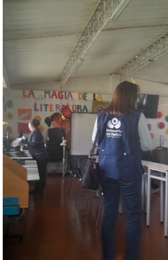
Defensoría del Pueblo. Institución Rural Técnico Pasquilla, 5 de octubre de 2023.

La Institución Rural Técnico Pasquilla está ubicada en la localidad de Ciudad Bolívar de Bogotá, D.C. En esta sede son atendidos aproximadamente 900 estudiantes, entre los 5 y 18 años de edad, en los niveles de preescolar, básica primaria, básica secundaria y media.