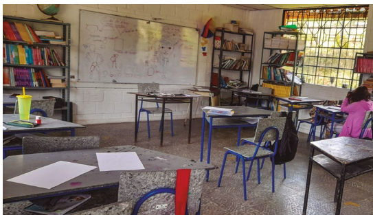
Defensoría del Pueblo. Visita a la sede educativa La Soledad (Pueblo Rico), el 1 de septiembre de 2023.