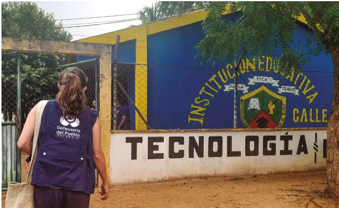
Defensoría del Pueblo. I.E. Técnica Callejón, sede El Callejón primaria, secundaria y media, 13 de septiembre de 2023.

La I.E. Técnica Callejón sede El Callejón primaria, secundaria y media se encuentra ubicada en el corregimiento Callejón del municipio de El Roble, Sucre 42 . Atiende un total de 310 estudiantes, cuyas edades oscilan entre los 4 y 19 años. La distribución por niveles educativos es la siguiente: 6 estudiantes en preescolar, 110 en básica primaria y 200 en básica secundaria.