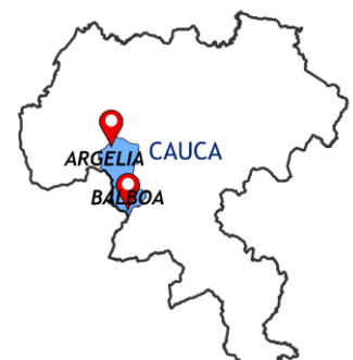
Figura 1. Mapa de eventos de movilidad humana forzada junio de 2024