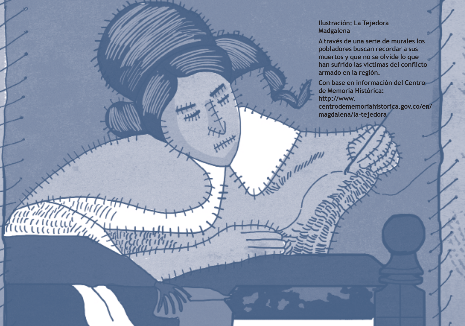
Ilustración: La Tejedora Madgalena

A través de una serie de murales los pobladores buscan recordar a sus muertos y que no se olvide lo que han sufrido las víctimas del conflicto armado en la región.