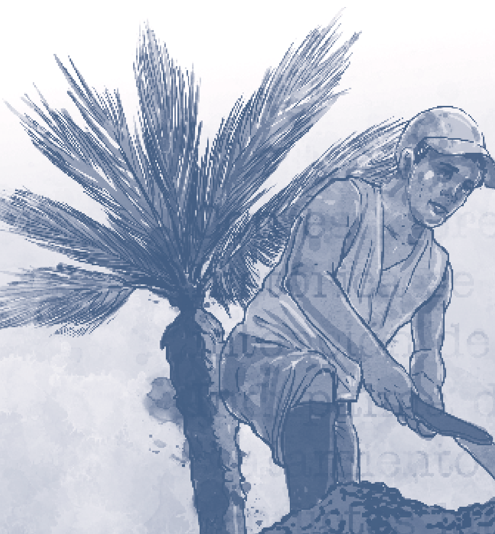
Ilustración: Memorias de las víctimas del sur del Cesar San Alberto y El Copey, Cesar

Es una publicación que busca esclarecer la verdad y reivindicar los derechos de los trabajadores de palma que vivieron la violencia durante la transformación de Indupalma, el modelo de cooperativas de trabajo asociado .